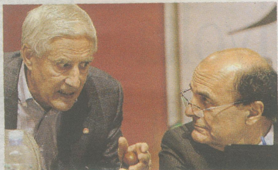
Franco Marini e Pierluigi Bersani

Dalla Cisl alla politica fino alla guida del Senato La partita del lupo marsicano un mastino delle trattative