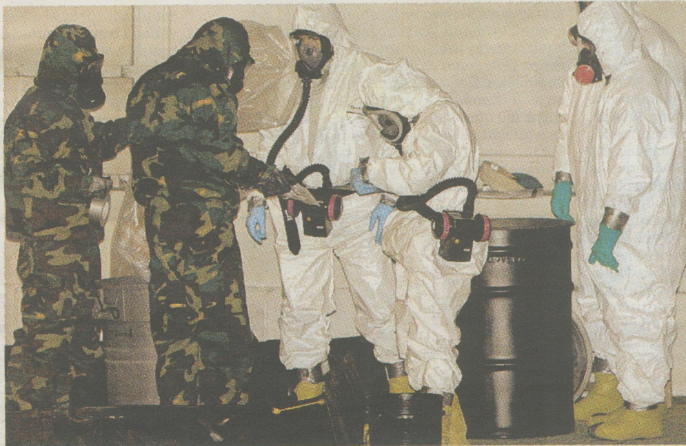
Controlli a Washington